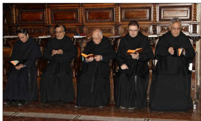
Capitulares durante el rezo del laudes.