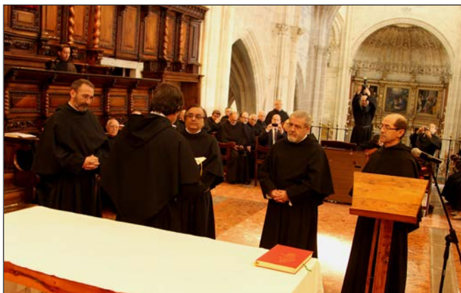
Confirmación de los PP. Consejeros.