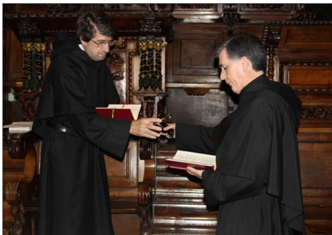
Entrega del sello de la Provincia al P. General como fin del mandato.

4. La necesaria renovación del ministerio sacerdotal por parte de los ordenados".