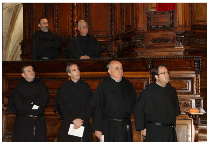
Capitulares durante la Profesión de fe.

Recurriendo a las nuevas tecnologías ( prezi ), el P. Provincial presentó el informe sobre el estado de la Provincia en los últimos cuatro años de su provincialato, destacando la estadística general sobre los religiosos y sus actividades, y señalando que "las defunciones, las salidas y la casi centena de hermanos mayores de 65 años enciende una 'luz roja' ante las estructuras que tenemos".