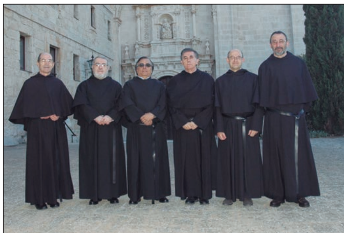
Nuevo Consejo Provincial.