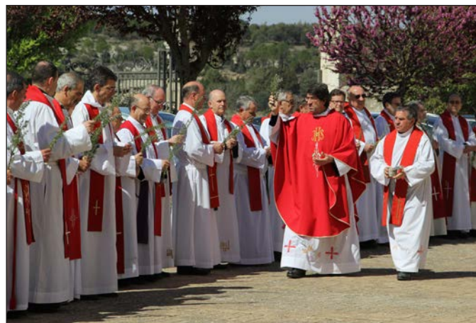
Eucaristía del Domingo de Ramos.

cisión señaló: "No podemos aceptar falsas soluciones. Tenemos que renovarnos desde nuestras propias raíces y afrontar los problemas con esperanza". Finalmente expresó el deseo de devolver el encanto a la vida agustiniana, con una visión positiva: "Tenemos que superar el reto del miedo, de la rutina, del estancamiento y de la desconfianza".