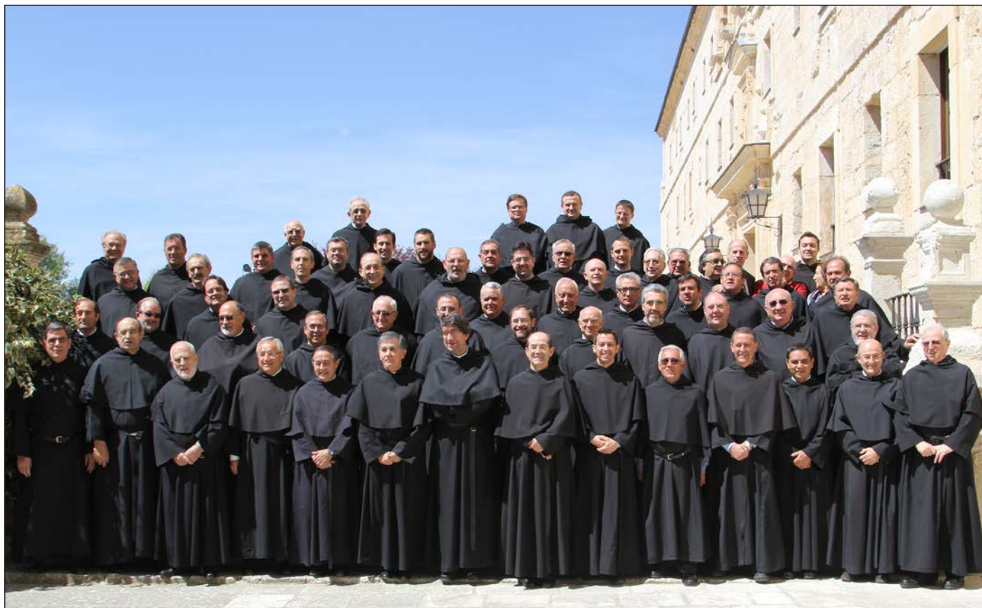
Foto de familia de los participantes en el Capítulo.