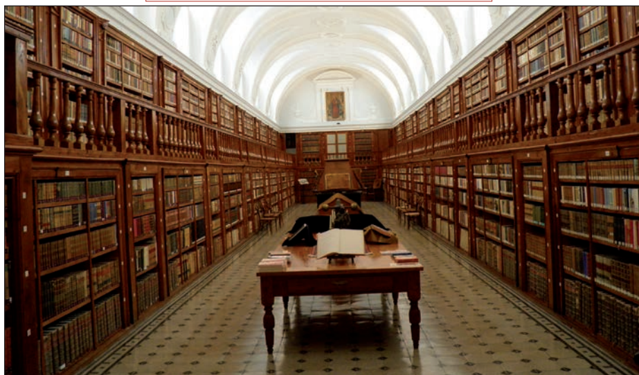
Vista general de la Biblioteca del Monasterio de La Vid.