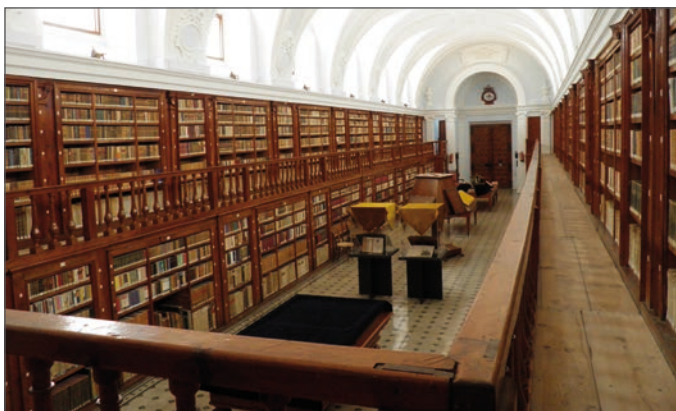
Vista general de la Biblioteca del Monasterio de La Vid.