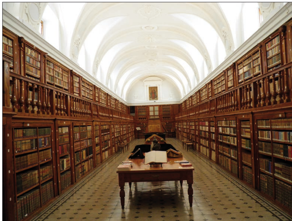
Vista general de la Biblioteca del Monasterio de La Vid.