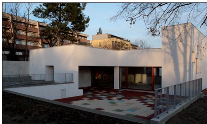
Colegio San Agustín de Praga

El mismo día de la bendición comenzaron las clases un grupo de 17 niños de 3 años de edad que se sumaron a los 30 que desde el comienzo del curso en septiembre reciben educación infantil en nuestro centro.