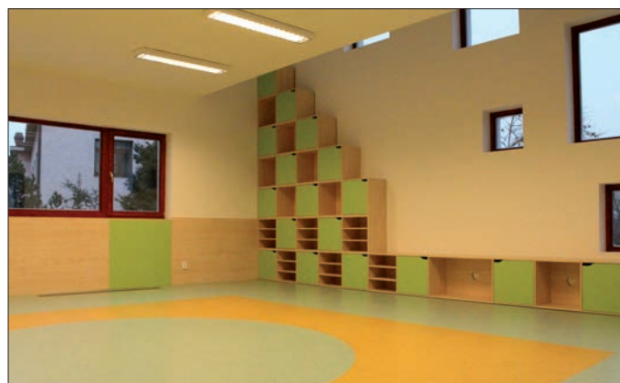
Nuevas Instalaciones del colegio