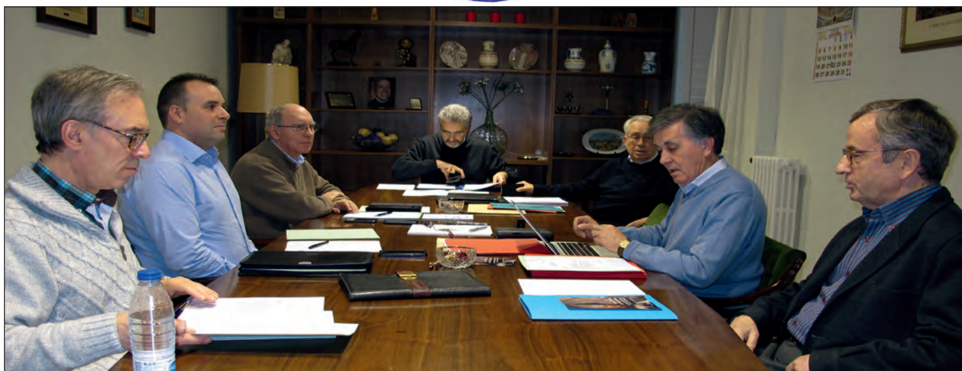
Reunión del Consejo de la Federación.