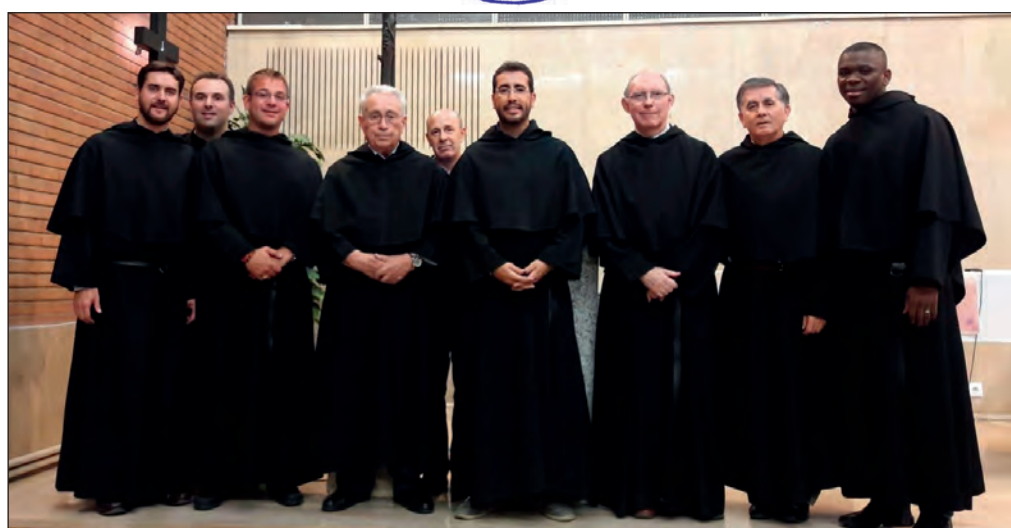
Inauguración de la nueva Comunidad de la Federación en el Colegio Mayor San Agustín de Madrid.