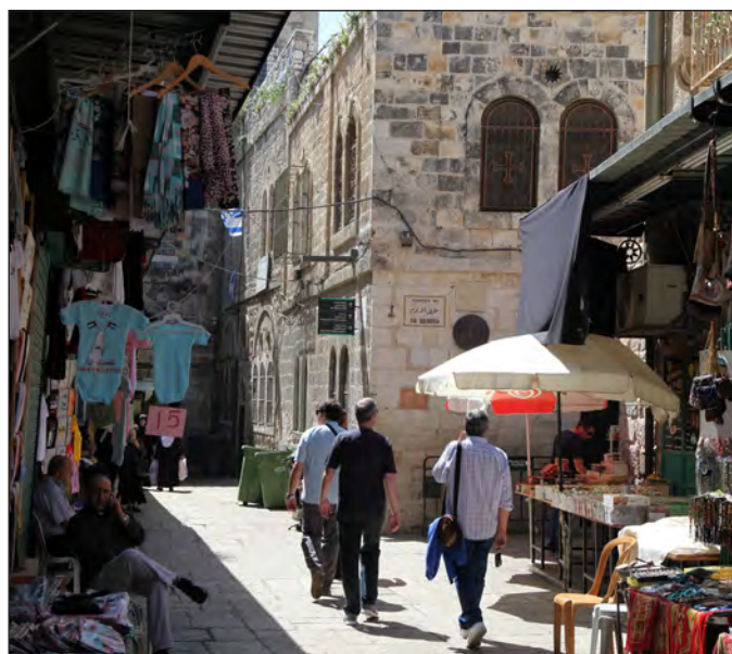
Vista de la Vía Dolorosa.

Continuamos, ahora bajando por montañas desérticas englobadas en el denominado desierto de Judea... Con gran sorpresa, nos encontramos con alguna que otra manada de perros domésticos, pero famélicos y asilvestrados. Probablemente originarios de desechos irresponsables de judíos que por razones de religión evitan la convivencia con los perros (no con los gatos). De qué se alimentarán estos animalitos en espacios tan