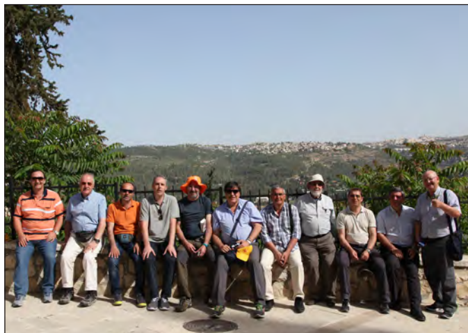
Mirador en la Basílica de la Visitación.

Hermón puede llegar la vista en días muy claros... Los autobuses grandes no pueden ascender hasta la cima, se hace con más pequeños.