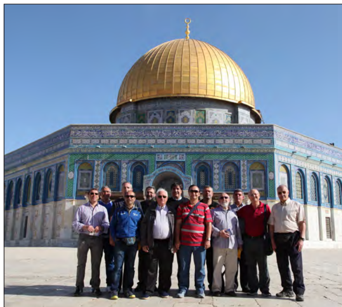
Peregrinos en la explanada de las mezquitas en Jerusalén.

"A Belén pastores"... Sí, llegamos a Belén, al llamado campo de los pastores ( Boh y Rut ). Visitamos la cueva y Santuario de los pastores, ( una de tantas cuevas como aún existen por aquel lugar montañoso y que sin duda eran utilizadas por los pastores, gente muy pobre). Alguno de los nuestros quería cantar villancicos, pero no pegaban los 30º de calor con