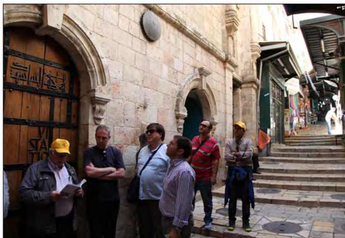
Rezando el Viacrucis.

Nuestro viaje en dirección a Petra transcurre por la carretera que va hacia el sur bordeando este lado del Mar Muerto, en un día de sol entre el mar y por la izquierda las montañas... Ahora toca subir a una altitud de 1500 m y durante 4 horas; a nuestras vistas subiendo entre montañas, que forman curiosos paisajes desérticos, pero no arenosos. Estas tierras fueron habitadas por Nabateos emigrados de la península arábiga, e instalados en estas rocosas gargantas que les garantizaban la seguridad. Fundada la ciudad 200 años antes de Cristo, trajeron su experiencias en la agricultura de Yemen, país fértil y buen controlador de regadíos, que les permite hacerse dueños del agua que ellos represan y venden a las caravanas de mercaderes que necesariamente