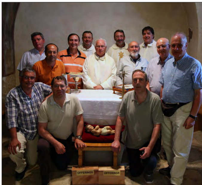
Foto del grupo en la Basílica de Belén.

día aparece todo el mundo, cuando se sirve ya el peor vino, es decir, lo que quede.