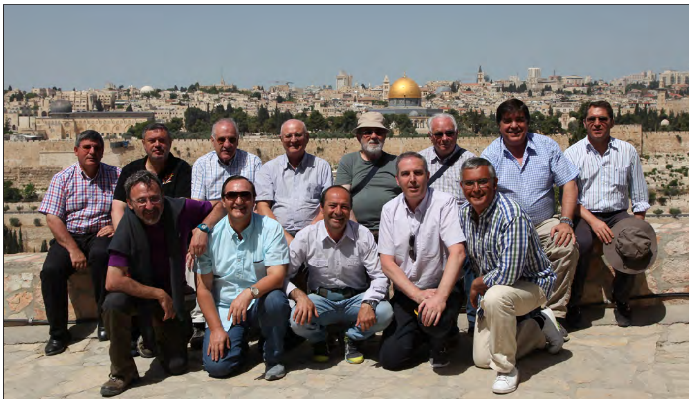
Mirando al Dominus Flevit, al fondo Jerusalén.