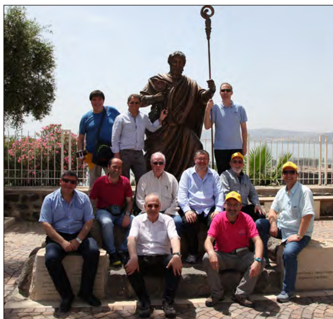
Grupo de Peregrinos, en Cafarnaúm.

Salimos para visitar las ruinas de la ciudad de Séforis , ("ciudad de los pájaros"; a 15 km. de Nazaret); construida en tiempo de Jesús por Herodes Antipas como ciudad