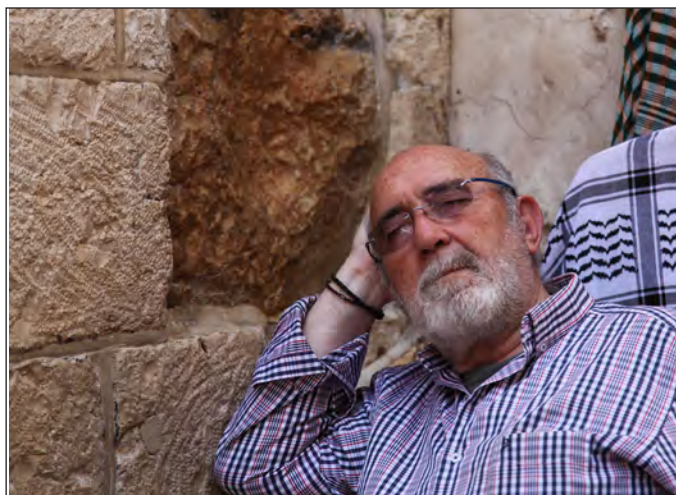
P. José, donde Jesús apoyo la mano, él apoya la cabeza.

Trajano, de origen español. Después ha permanecido desconocida hasta que un arqueólogo suizo la dio a conocer en 1985. El Mar Muerto nos ofrece cobijo en el hotel Ramada otra noche, que nuestro cuerpo cansado agradece.