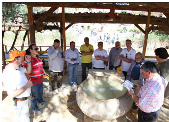
Renovando las promesas del Bautismo en el Jordán.