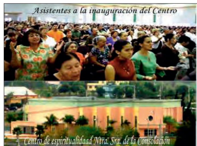
Asistentes a la inauguración del Centro

dad puertorriqueña ha dado tres vocaciones, dos de las cuales perseveran; una ejerce su misión apostólica en Aguada y otra en Santo Domingo —R.D.—. La actual comunidad agustiniana está integrada por cuatro religiosos. La parroquia posee su casa parroquial, residencia de los religiosos, con sus propias oficinas, todo ello propiedad de la Orden agustiniana.